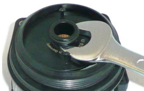
Вид без пенопласта