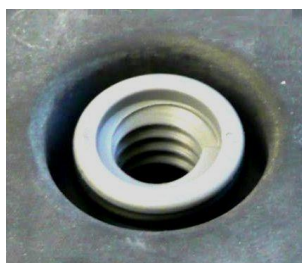
Внутренний диаметр фильтра с резьбой для навинчивания

Естественно, фильтр как и прежде соответствует требованиям завода-изготовителя автомобилей и применяется на всех автомобилях, которые перечислены в нашем печатном каталоге MANN-FILTER или в онлайн-каталоге по адресу: catalog.mann-filter.com .