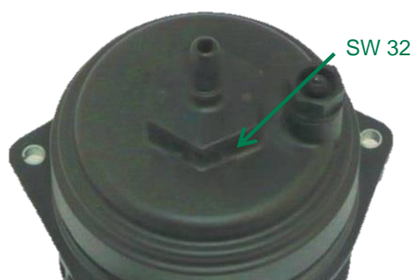
Вид с закрытой крышкой

Инструмент: гаечный ключ с открытым зевом шириной 32